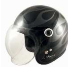
JS-65GX Σ BK/GM/FIRE