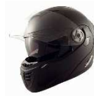
PT-2 H.MAD BK