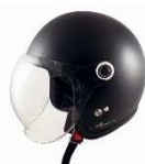
JS-65GX Σ H.MAD BK