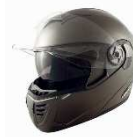
PT-2 H.MAD GM